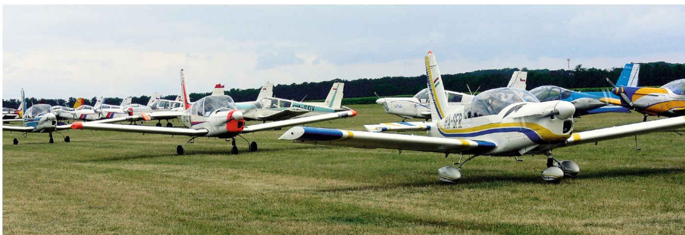
• Trnava 2018. Přípravuje se vzlet velkoskupiny letadel.