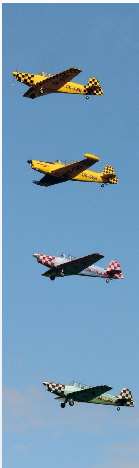
• Skupina Follow Me je tradičním účastníkem sletů.

„Za uplynulých pět let podpořila Slet řada leteckých podniků a organizací, za což jsme jim nesmírně vděční. Rád bych zmínil ty nejvýznamnější, mezi kte-