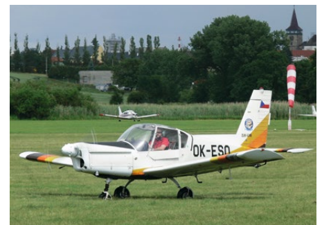
• ...Jičín 2016...