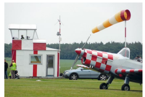
• ...a Jaroměř 2017.