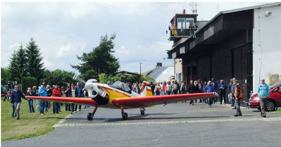
• A malé ohlédnutí v čase zpět: Vysoké Mýto 2015...