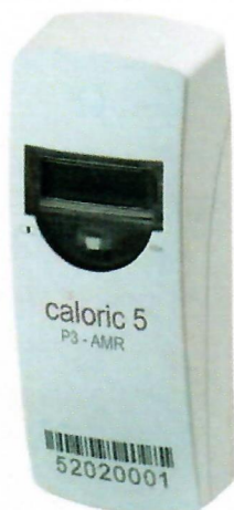
Elektronický rozdělovač topných nákladů CALORIC 5